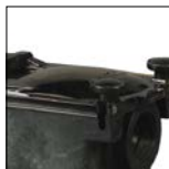
Couvercle de préfiltre transparent