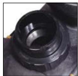
Raccords unions fournis